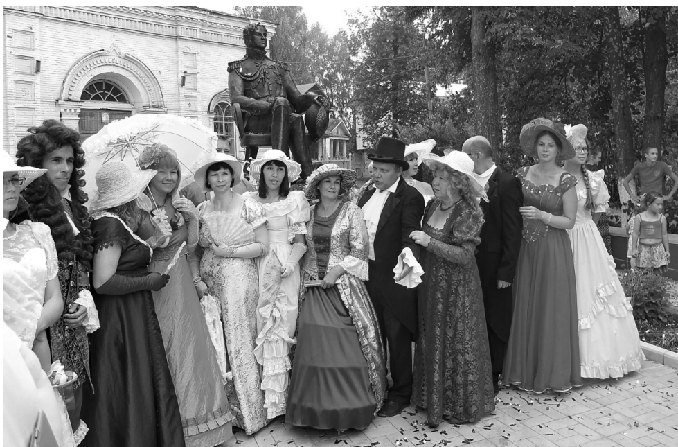
Opening of the monument to Count Pavel Stroganov in Pavlovsky, Perm Oblast, July 23, 2016.