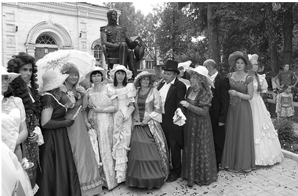
Открытие памятника графу Павлу Строганову в пос. Павловский, Пермский край, 23.07.2016.

В марте 2021 г. консалтинговая компания «Стрелка» рассчитала индекс туристической привлекательности регионов России, основанный на впечатлениях путешественников (было проанализировано более 6 млн публикаций в социальных сетях). Эксперты пришли к выводу, что «нематериальное наследие – преимущество на туристическом рынке» 26 . В результате их исследования было выявлено, что уникальная нематериальная культура регионов – музыка, танец, кулинария, язык, традиции, ремесла, религия – сегодня опережает по количеству упоминаний памятники архитектуры, исторические достопримечательности и другие элементы материального наследия, а по доле позитивных текстов нематериальная культура уступает только впечатлениям о природе. Все это объясняет растущую популярность реконструкции образов прошлого через сближение с их практиками: нарядами и церемониями. Конструирование исторической памяти должно подкрепляться практиками публичной истории, через которые возможно включение людей в те смыслы, которые заложены в местах памяти. Более того, с помощью символических действий и практик публичной истории образы прошлого получают новое звучание и новые возможности для применения.