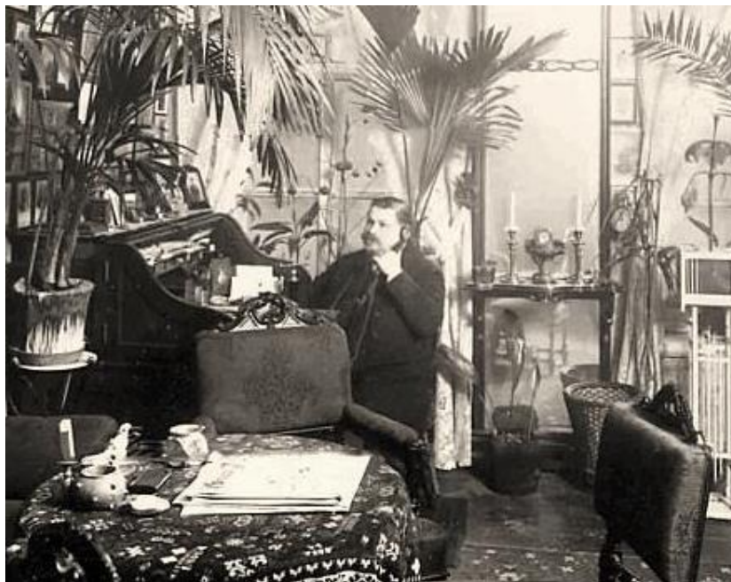
Князь Михаил Михайлович Андроников в своем кабинете, 1916 г.

наблюдения за Распутиным, следует признать, что знакомство состоялось не позднее декабря 1914 г.