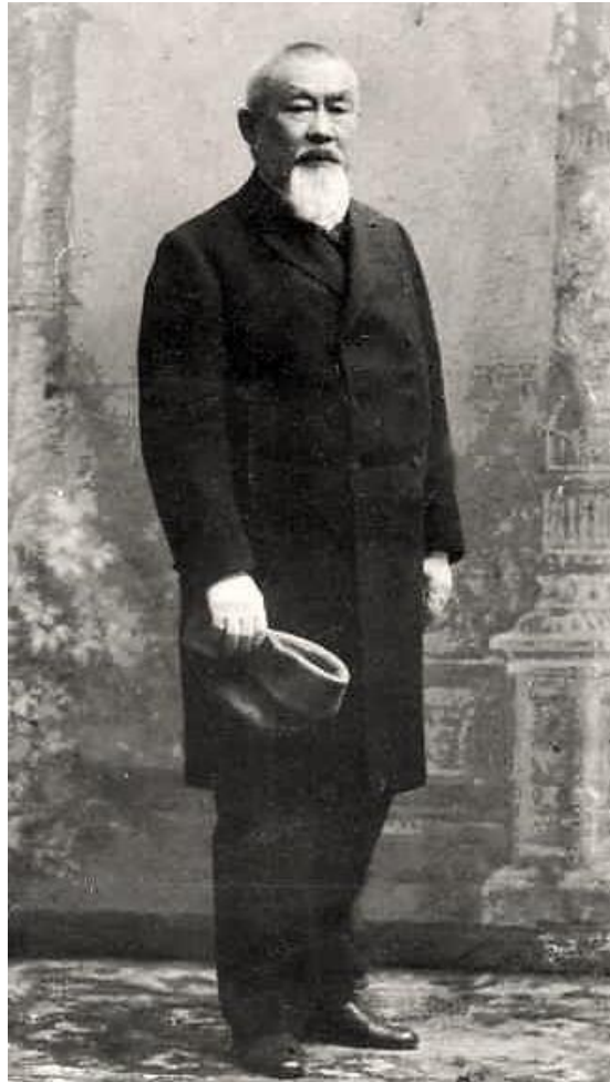
Pyotr Aleksandrovich Badmaev

The salon of P. Badmaev. Rasputin was well acquainted with doctor Pyotr Aleksandrovich Badmaev, 50 an expert in Tibetan medicine and organizer of a right-wing monarchist circle, which is commonly believed to have a certain influence at the court of the Emperor.