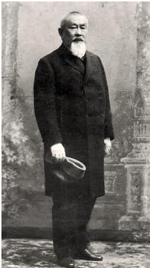
Петр Александрович Бадмаев

Салон П.А. Бадмаева. Г.Е. Распутин был хорошо знаком с врачом, специалистом по тибетской медицине Петром Александровичем Бадмаевым 50 , организатором одного из правомонархических кружков, который, как принято считать, якобы имел определенное влияние при Дворе.