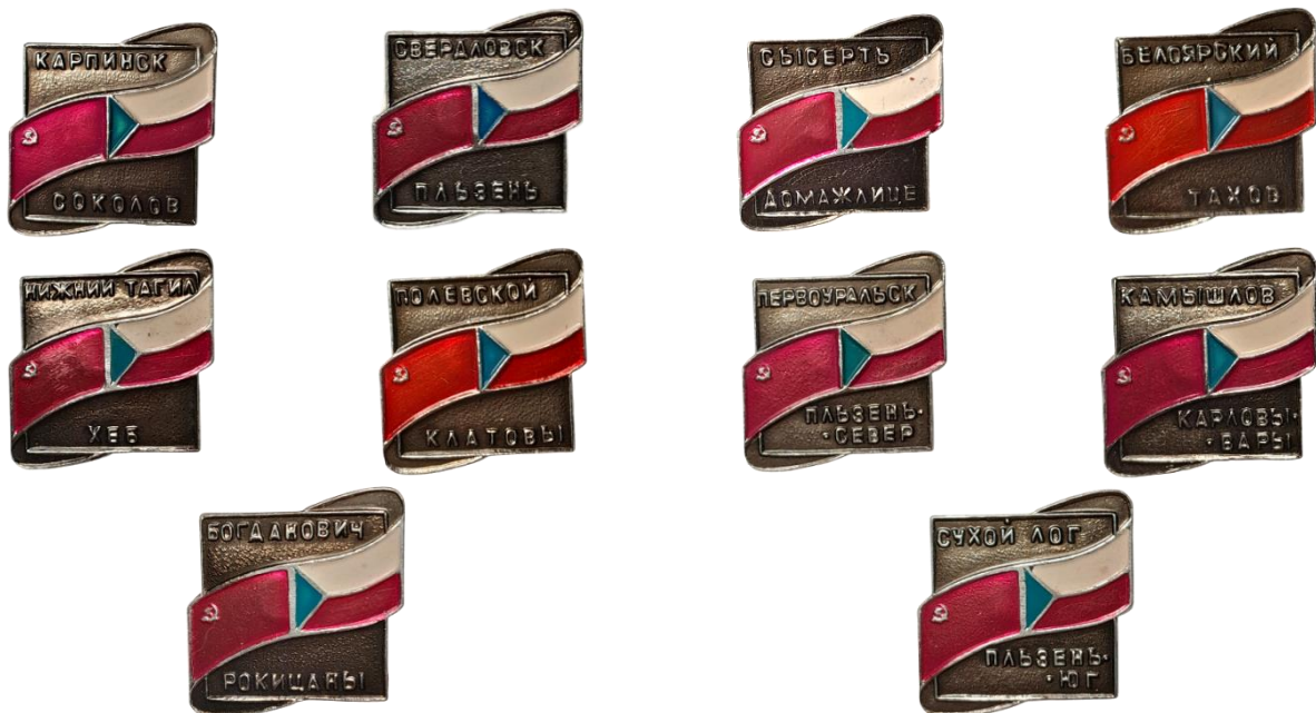
Рис. 3. Знаки из личного архива М.В. Бекленищевой [Fig. 3. Badges from the personal archive of M. Beklenishcheva]