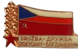
Знак из фондов Богдановичского краеведческого музея [Badge from the Bogdanovich Local History Museum]