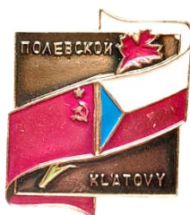
Рис. 5. Знак «Города-побратимы: Полевской – Клатовы»

[Fig. 4. Badge for the festival of friendship between Soviet and Bulgarian youth held in Kiev in 1971. Badge from the personal archive of M. Beklenishcheva]