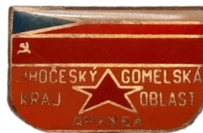
Рис. 12. Знаки из личного архива М.В. Бекленищевой [Fig. 12. Badges from the personal archive of M. Beklenishcheva]