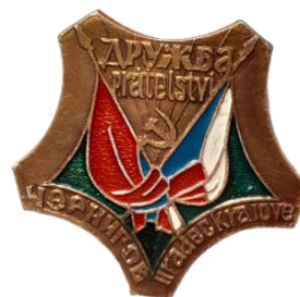
Знак «Города-побратимы: Черников – Градец Кралове» (Черниговская область и Восточночешская область) [The badge of Twin cities of Chernikov and Hradec Kralove (Chernigov Oblast and East Bohemian Region)]