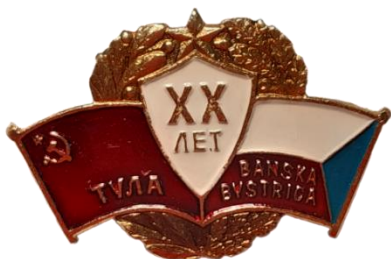
Знак «20 лет дружбы: Тула – Банска Быстрица» (Тульская область и Среднесловацкая область) [The badge of 20 Years of Friendship between Tula and Banska Bystritsa (Tula Oblast and Central Slovak Region)]