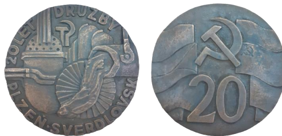
Рис. 25. Настольная медаль и удостоверение к ней из фондов музея Первоуральского динасового завода [Fig. 25. Table medal and its certificate from the museum of the Pervouralsk Silica Plant]