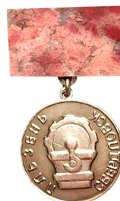
Рис. 7. Знак из личного архива М.В. Бекленищевой

[Fig. 6. Badge from the personal archive of M. Beklenishcheva]