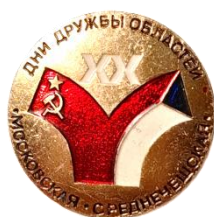
Рис. 11. Знаки из личного архива М.В. Бекленищевой [Fig. 11. Badges from the personal archive of M. Beklenishcheva]

Знак «Свердловск – Пльзень», посвященный 40-летию Победы в Великой Отечественной войне [The badge of Sverdlovsk–Plzen dedicated to the 40 th anniversary of Victory in the Great Patriotic War]