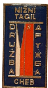
Рис. 1а. Знаки из личного архива М.В. Бекленищевой [Fig. 1a. Badges from the personal archive of M. Beklenishcheva]