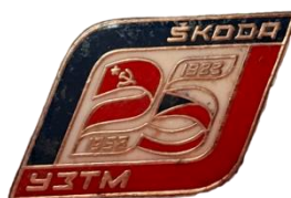
Рис. 15. Знаки из личного архива М.В. Бекленищевой [Fig. 15. Badges from the personal archive of M. Beklenishcheva]