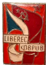
Знак «Города-побратимы: Ковров – Либерец» (Владимирская область и Северочешская область) [The badge of Twin Cities of Kovrov and Liberec (Vladimir Oblast and North Bohemian Region)]