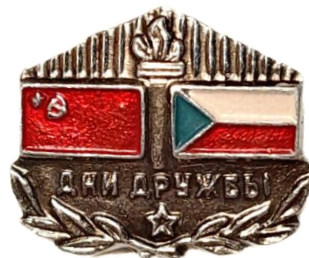
Рис. 23. Знаки из личного архива М.В. Бекленищевой [Fig. 23. Badges from the personal archive of M. Beklenishcheva]