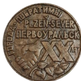
Рис. 27. Настольная медаль из личного архива М.В. Бекленищевой [Fig. 27. Table medal from the personal archive of M. Beklenishcheva]