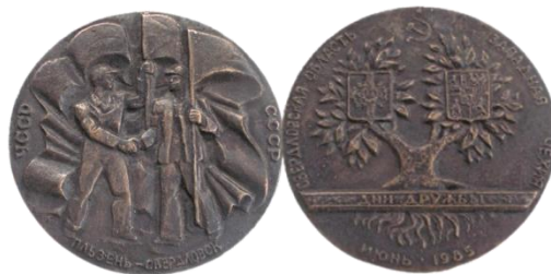
Рис. 21. Настольная медаль из фондов музея Первоуральского хромпикового завода [Fig. 21. Table medal from the Pervouralsk Khrompik Plant Museum]