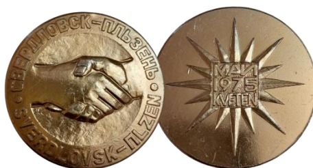
Рис. 19. Настольная медаль из личного архива М.В. Бекленищевой [Fig. 19. Table medal from the personal archive of M. Beklenishcheva]