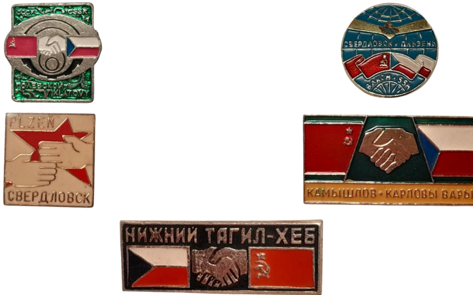
Рис. 2. Знаки из личного архива М.В. Бекленищевой [Fig. 2. Badges from the personal archive of M. Beklenishcheva]