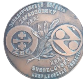
Рис. 26. Медаль из фондов музея Первоуральского хромпикового завода [Fig. 26. Medal from the museum of the Pervouralsk Khrompik Plant]