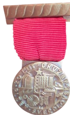
Рис. 24. Медаль и удостоверение к ней из фондов Богдановичского краеведческого музея [Fig. 24. Medal and its certificate from the Bogdanovich Local History Museum]