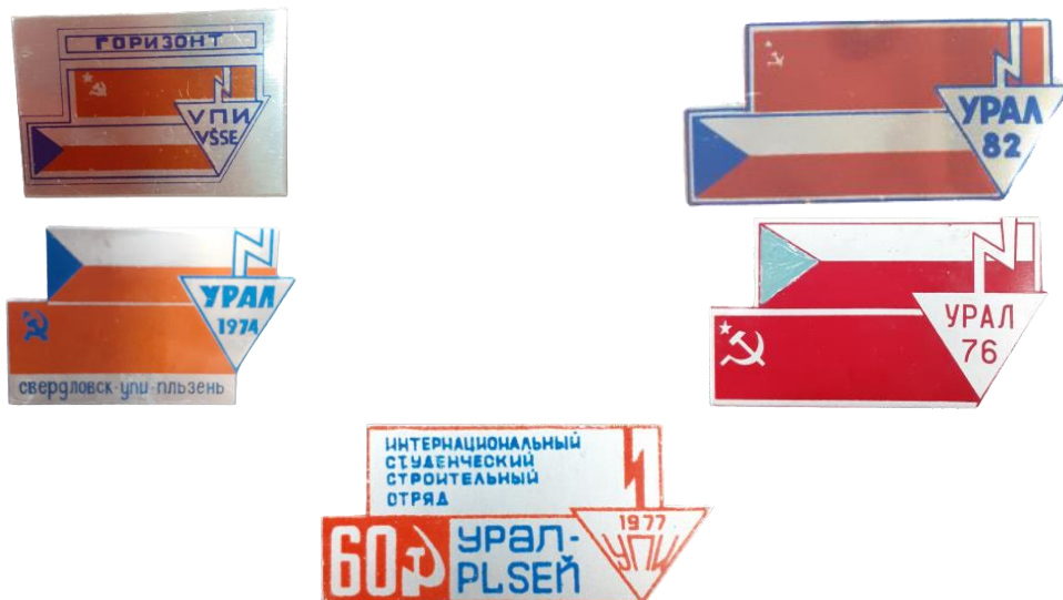
Рис. 28. Знаки из фондов Музейно-выставочного комплекса Уральского федерального университета им. первого Президента России Б.Н. Ельцина [Fig. 28. Badges from the Museum and Exhibition Complex of the Ural Federal University named after the first President of Russia B. Yeltsin]