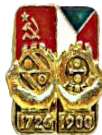
Казанцев А.Г. Описание значков, медалей, плакеток с гербами, символами и юбилеями населенных пунктов, районов и муниципальных образований Свердловской области. Екатеринбург: [б. и.], 2023. С. 174 [A.G. Kazantsev, Description of Badges, Medals and Plaques with Emblems, Symbols and Anniversaries of Settlements, Districts and Municipalities of Sverdlovsk Oblast [in Russian] (Yekaterinburg: [n. p.], 2023), 174]