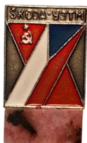
Знаки из личного архива М.В. Бекленищевой [Figs. 13, 14. Badges from the personal archive of M. Beklenishcheva]