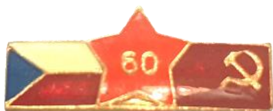
Рис. 8. Знак из личного архива Л.С. Панфиловой (г. Полевской) [Fig. 8. Badge from the personal archive of L. Panfilova (the city of Polevskoi)]

[Fig. 7. Badge from the personal archive of M. Beklenishcheva]