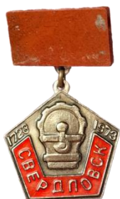
Рис. 6. Знак из личного архива М.В. Бекленищевой

[Fig. 5. The badge of Twin cities of Polevskoi and Klatovy. Badge from the personal archive of M. Beklenishcheva]