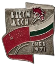
Рис. 4. Знак к фестивалю дружбы советской и болгарской молодежи, состоявшемуся в Киеве в 1971 году.