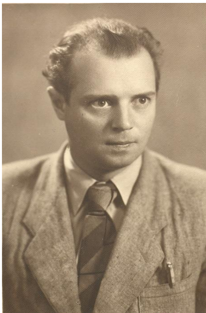
А.С. Есенин-Вольпин в Черновцах. 21 июля 1956 г. 54

В конце декабря 1950 г. Есенин-Вольпин переселился в две комнаты государственного одноэтажного барака, обходившиеся ему в 12 руб. в месяц. Чтобы топить печь, математик нанял соседку, жившую в соседнем бараке. За 120 руб. в месяц она также носила ему воду из колодца, стирала белье и мыла полы 55 . Однако условия жизни в бараке по-прежнему казались Есенину-Вольпину посредственными: