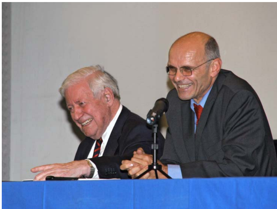
Встреча с бывшим канцлером ФРГ Г. Шмидтом, в ГИИМе (2007 г.)

двух секциях «школы» бурно обсуждались прямые и извилистые пути развития этой страны и ее взаимодействие с соседями.