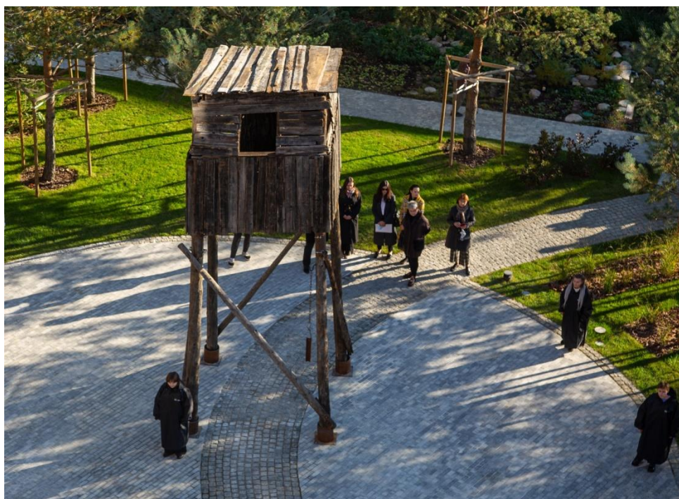
A camp tower from the territory of the Dneprovskii mine, where prisoners mined tin almost by hand. Between 1941 and 1955

The Garden of Memory was conceived as a continuation of the museum exposition. Its memorial part consists of trees, stones, and shrubs brought from the Solovetsky Islands, the Caucasus, Kazakhstan, the Urals, the Kolyma, and the Far East. The history of each tree, bush or boulder in the Garden of Memory is closely connected with the fate of prisoners, places where executions were carried out, or where convicts served their sentences. For instance, the Norway maple is a memory of the ‘Kommunarka’ shooting range, Siberian larch and Siberian dwarf pine remind of the Butugychag camp, rolled boulders are connected with the Solovetsky Islands. Many trees were planted by relatives of victims of repression in memory of their loved ones. In the center of the exposition there is a tower brought from the territory of the former Dneprovskii camp. This unique museum exhibit is a typical and unchanging attribute of camp architecture.