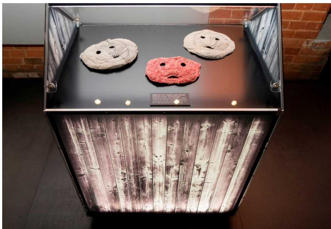
Витрина с самодельными масками, изготовленными заключенными для защиты лица от мороза и ветра. Между 1948 и 1953 г. Экспонаты выставки «Национальная память о ГУЛАГе», предоставленные ГБУ Ямало-Ненецкого автономного округа «Ямало-Ненецкий окружной музейно-выставочный комплекс имени И.С. Шемановского».

экспонаты из разных уголков России, что расширяло пространство музейной коммеморации до масштабов всей страны.