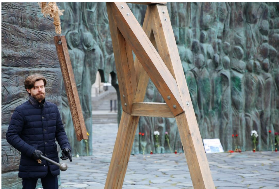
Коммеморативная акция «Колокол памяти».

Во многих экспозициях, посвященных истории ГУЛАГа, присутствует в качестве экспоната кусок железнодорожного рельса. И это совсем не случайно. По давней традиции день в лагере начинался и заканчивался под монотонные звуки ударов по рельсу. «В пять часов утра, как всегда, пробило подъем – молотком об рельс у штабного барака», – так начинается рассказ А.И. Солженицына «Один день Ивана Денисовича». Куски рельсов – стальные узкие бруски – в лагерной неволе служили своеобразными колоколами. Именно в таком качестве их используют в настоящее время во многих музейно-мемориальных комплексах. В рельс-колокол ударяют в торжественные моменты открытия новых экспозиций, при проведении общественно значимых коммеморативных акций и в других особо важных случаях.