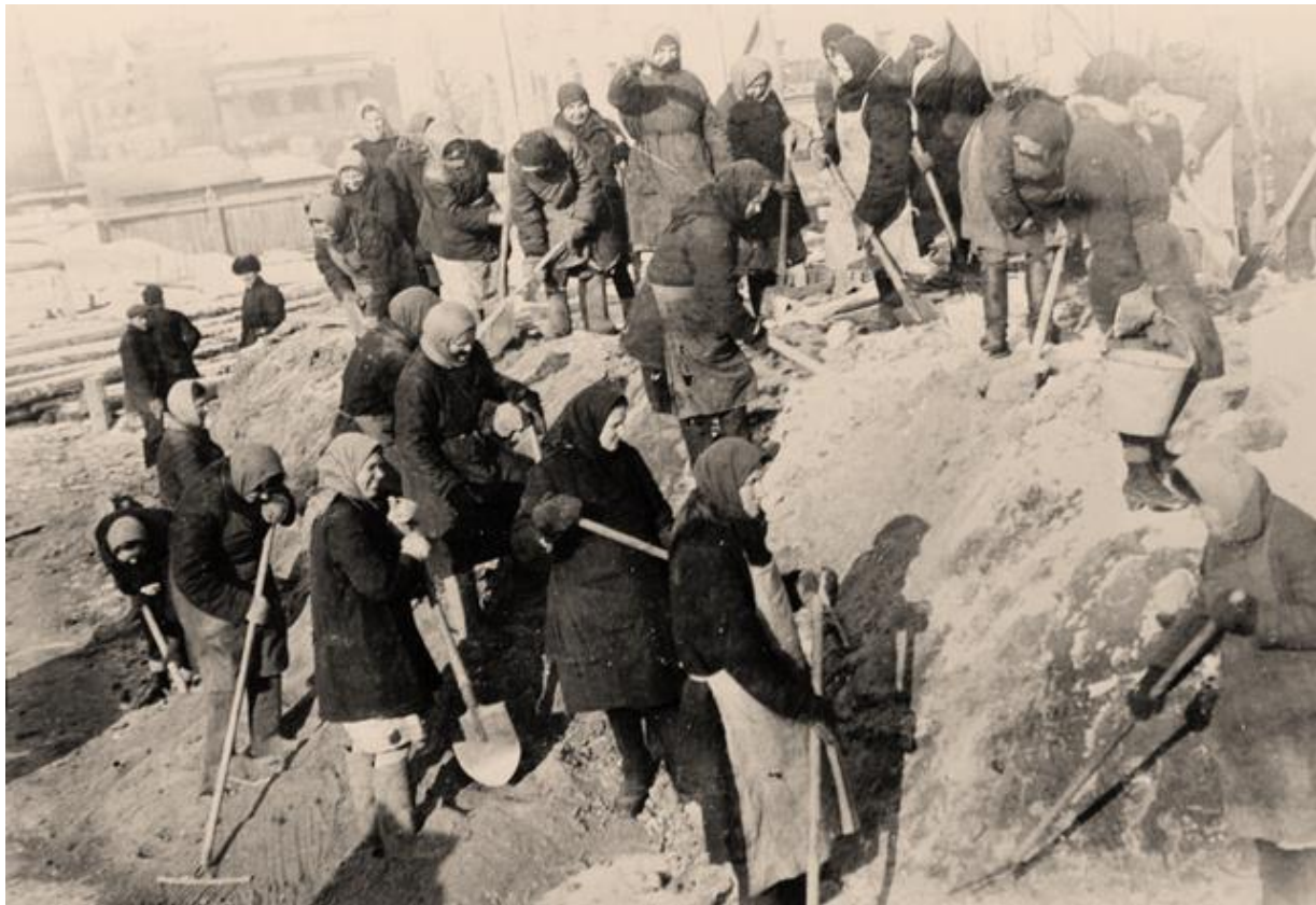
Civilian population at the construction of defensive lines. Siege of Leningrad.

summer and autumn 1941, as part of labor and horse-drawn service, the population of Vologda Oblast worked on the construction of 26 operational airfields. 35